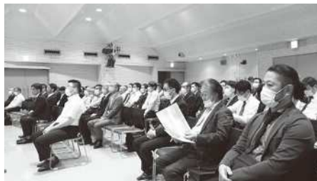
久留米地区での開催の様子