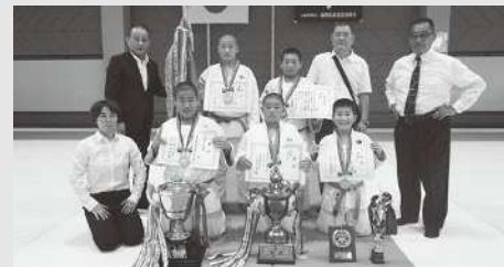
優勝の月隈武徳館道場

最後になりましたが、本大会開催にあたり温かいご理解とご協力を頂いた関係各位の皆様、並びに大会運営係としてお手伝い頂いた会員の先生方に感謝申し上げます。