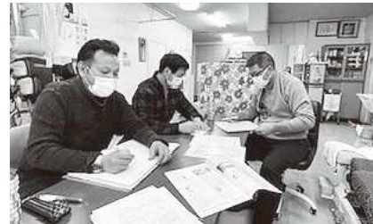
第3回筑豊支部役員会の様子