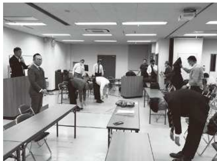
福岡東・南支部合同定例会の様子(令和5年11月25日)