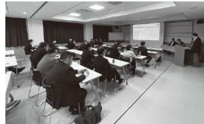
第2回筑豊支部定例会の様子