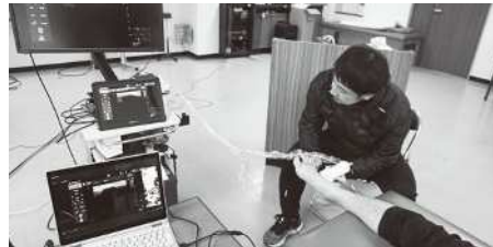
第4回講習会の様子(2月11日)