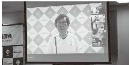
第4回講習会の様子(2月11日)