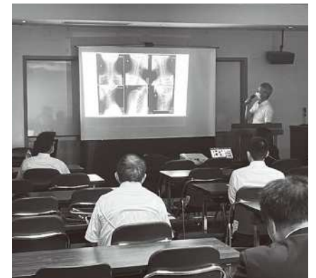
第2回定例会の様子(令和5年9月9日)