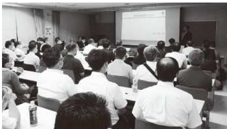
大牟田・有明地区での開催の様子