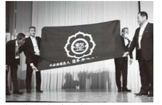
大会旗引き継ぎ式の様子