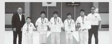
3位の筑前町スポーツ少年団夜須柔道部