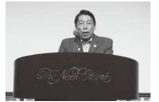
服部誠太郎福岡県知事挨拶