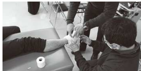
第4回講習会の様子(2月11日)