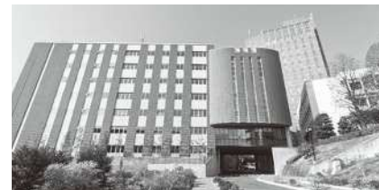
名城大学天白キャンパス