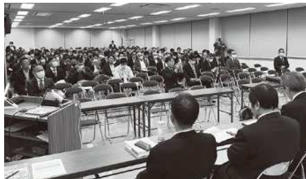
福岡地区での開催の様子